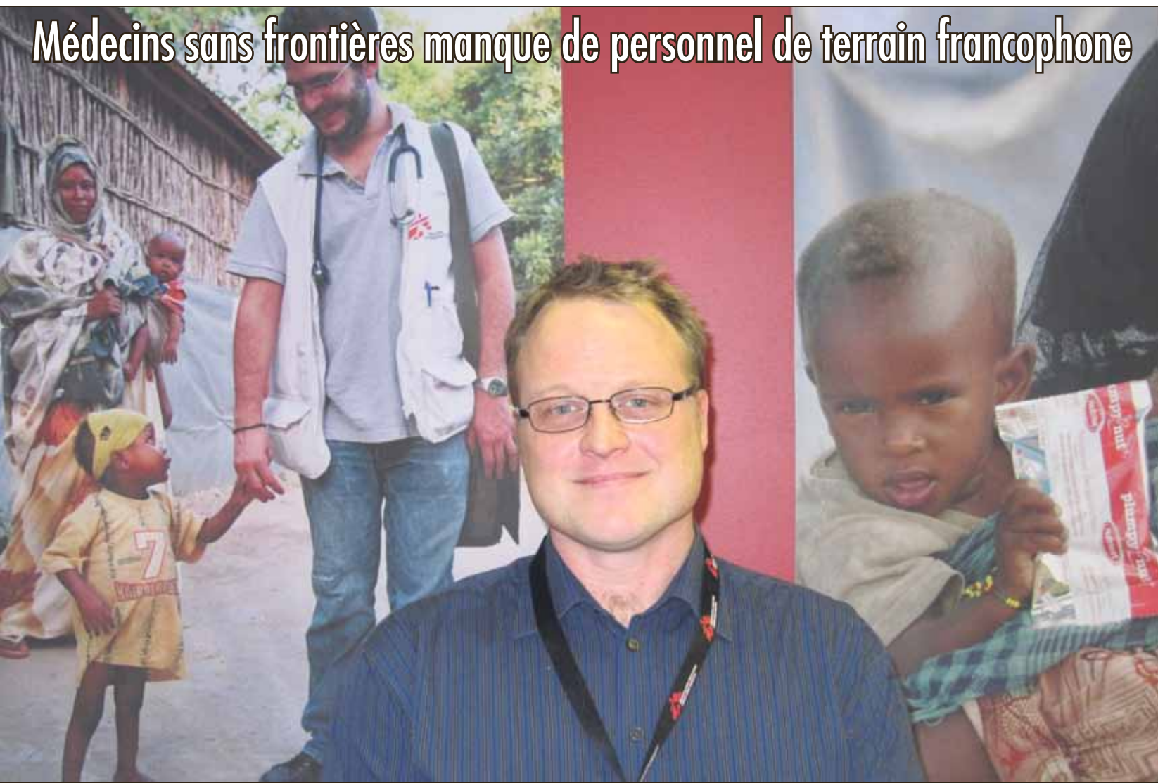
Médecins sans frontières manque de personnel de terrain francophone